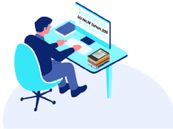
Penyuluh hukum mempersiapkan materi

Materi yang disuluhkan ditentukan berdasarkan hasil evaluasi,peta permasalahan hukum, kepentingan negara dan kebutuhan masyarakat dalam bentuk naskah dan ceramah, dan permasalahan hukum yang secara spontan timbul dalam kegiatan Temu Sadar Hukum.