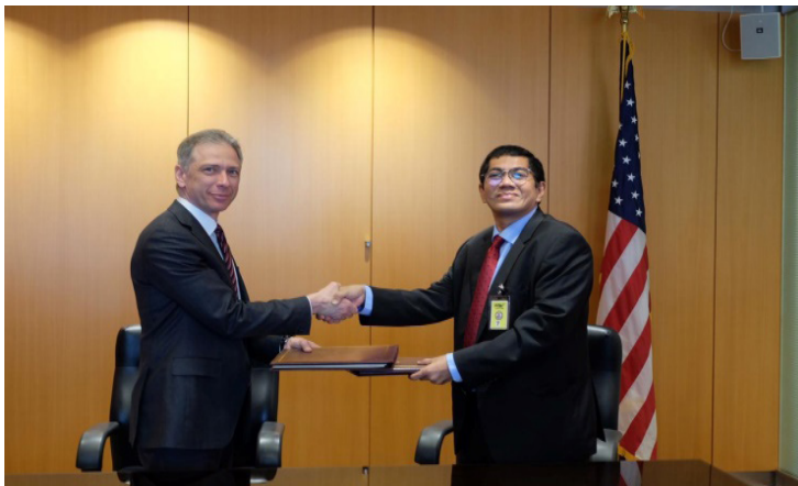
Gambar 2.

Kerja sama antara DJKI dan USPTO merupakan sinergi yang positif bagi kedua belah pihak. Dengan adanya MoU ini, diharapkan secara kooperatif dapat mengembangkan dan mengelola bantuan teknis dan program pelatihan dibidang KI antara kantor Kekayaan Intelektual tersebut. 72