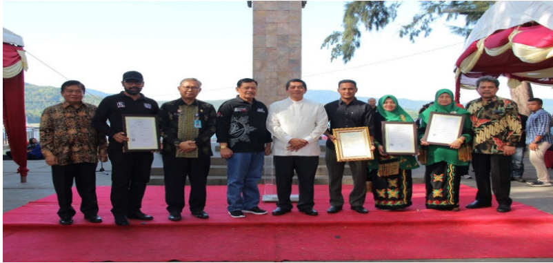
Gambar 13. Direktur Jenderal KI, Direktur Merek dan Indikasi Geografis, Direktur Teknologi Informasi KI, Kepala Kantor Wilayah Kemenkumham Aceh berfoto bersama Walikota Sabang dan penerima surat pencatatan Hak Cipta