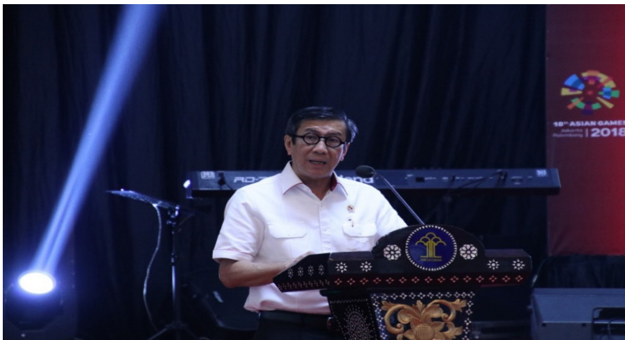
Gambar 3. Menteri Hukum dan HAM RI menyampaikan sambutannya

Acara ini terbuka untuk masyarakat umum tanpa dipungut biaya. Lebih dari itu, di pameran ini para pelaku usaha difasilitasi pendaftaran merek secara gratis. Hal ini merupakan upaya dalam meningkatkan kualitas dan produktifitas sektor Usaha Kecil dan Menengah (UKM).