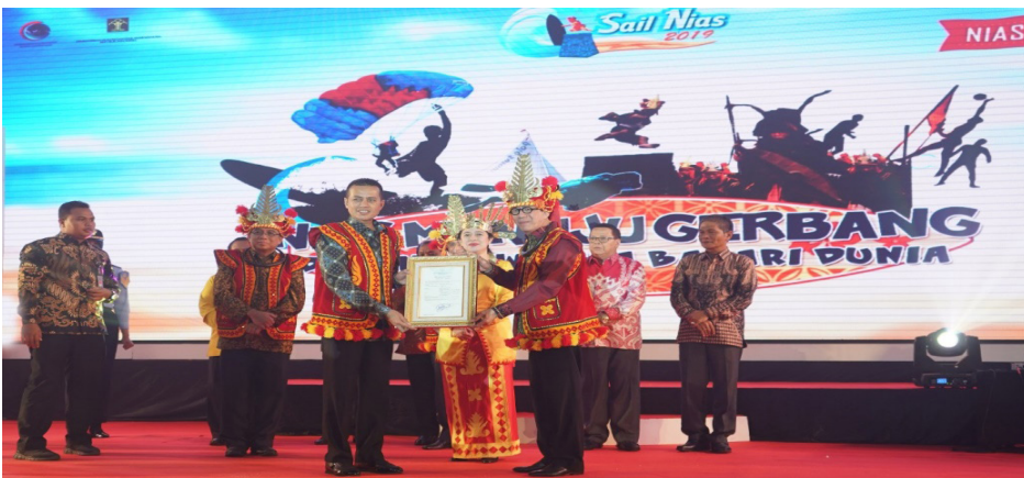
Gambar 11. Menteri Hukum dan Hak Asasi Manusia (Menkumham) menyerahkan Surat Pencatatan Inventarisasi Kekayaan Intelektual Komunal (KIK) - Ekspresi Budaya Tradisional (EBT) yang berasal dari Pulau Nias kepada Wakil Gubernur Sumatera Utara dan Bupati Nias Selatan

Sail Indonesia yang merupakan ajang tahunan wisata bahari yang telah diselenggarakan sejak 2009 oleh Kementerian Koordinator Bidang Kemaritiman menunjuk Nias, Sumatera Utara, sebagai tuan rumah Sail Indonesia untuk tahun 2019. Penunjukan Nias sebagai kandidat tuan rumah Sail Indonesia ini pun dijadikan momen untuk membangun perekonomian daerah. Salah satu hal yang dapat menarik perhatian wisatawan domestik maupun mancanegara, yaitu dengan menyuguhkan keunikan ekspresi budaya tradisional yang dijaga secara turun temurun. Oleh karenanya, inventarisasi terhadap EBT ini perlu dilakukan agar terlindungi dari pengakuan negara lain.