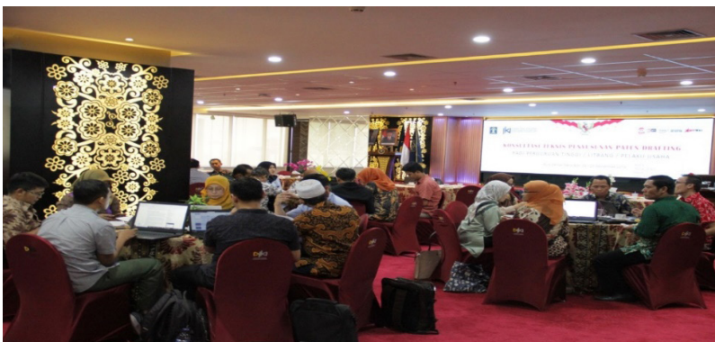
Gambar 10. Suasana kegiatan konsultasi teknis