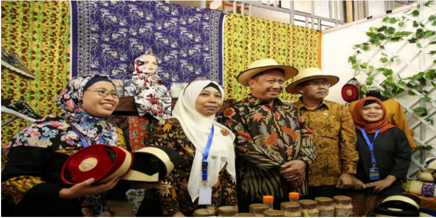
Gambar 4. Sekretaris Jenderal Kementerian Hukum dan HAM RI berfoto bersama peserta pameran