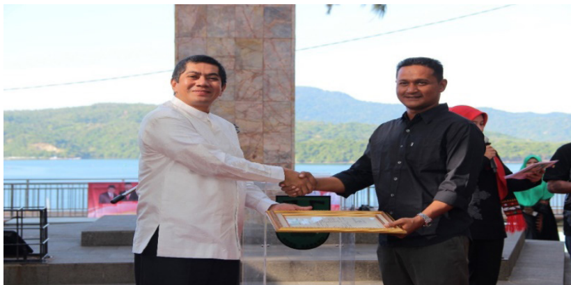
Gambar 12. Direktur Jenderal Kekayaan Intelektual menyerahkan Surat Pencatatan Inventarisasi Kekayaan Intelektual Komunal (KIK) - Ekspresi Budaya Tradisional (EBT) “Khanduri Laot Festival” kepada Walikota Sabang

Pada kesempatan yang sama, diserahkan pula beberapa surat pencatatan ciptaan, yaitu Buku Katalog Kerajinan yang Terbuat dari Batang Kelapa di Kota Sabang; Lagu Sabang Kota Pariwisata; dan Motif Bordir Bunga Kelapa.