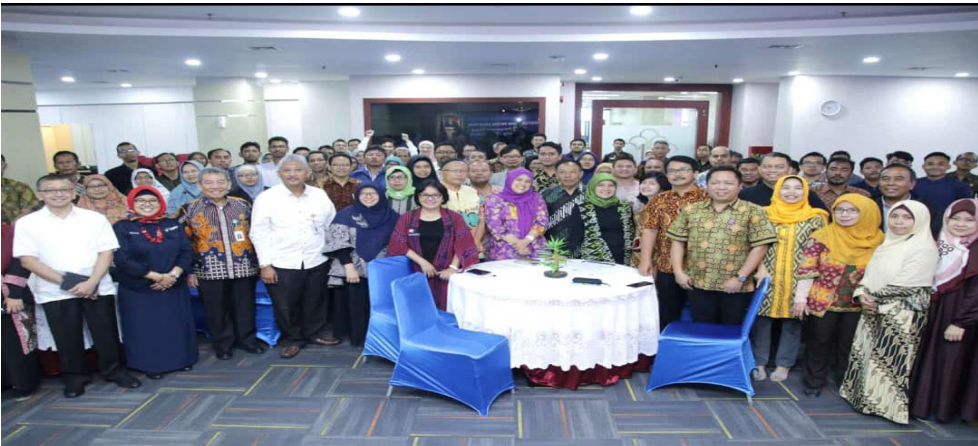
Gambar 6. Narasumber Direktur Paten, DTLST dan RD, Kasubdit Pemberdayaan KI dan Pemeriksa Paten berfoto bersama peserta Konsultasi Teknis

keahliannya, dan 92% berpendapat bahwa materi yang diperoleh dari kegiatan ini dapat atau cukup dapat diterapkan dalam lingkungan kerjanya. Dari aspek penyajian materi 81% peserta menilai bahwa materi disampaikan dengan jelas, dan 78% menilai bahwa kegiatan ini berhasil meningkatkan pengetahuan dan keahlian peserta.