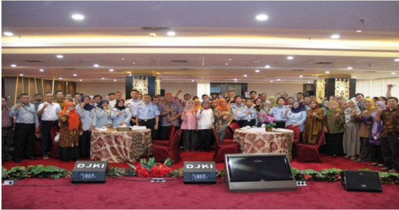
Gambar 8. Dir. KSP, narasumber (Pemeriksa Paten), dan peserta kegiatan berfoto bersama