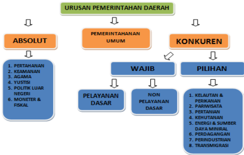
Tabel. Urusan Pemerintahan Daerah

Berdasarkan Undang-Undang Nomor 23 Tahun 2014 klasifikasi urusan pemerintahan terdiri dari 3 (tiga) urusan yakni urusan pemerintahan absolut, urusan pemerintahan konkuren, dan urusan pemerintahan umum. Urusan pemerintahan absolut adalah urusan Pemerintahan yang sepenuhnya menjadi kewenangan Pemerintah Pusat. Urusan pemerintahan konkuren adalah Urusan Pemerintahan yang dibagi antara Pemerintah Pusat dan Daerah provinsi dan Daerah kabupaten/kota. Urusan pemerintahan umum adalah Urusan Pemerintahan yang menjadi kewenangan Presiden sebagai kepala pemerintahan.